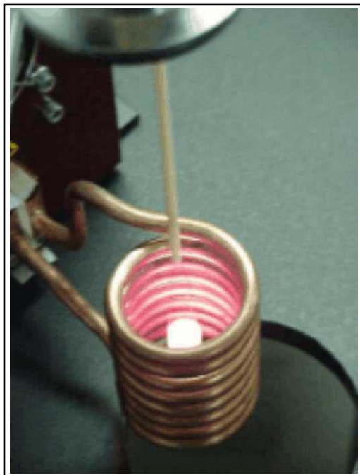
Abbildung: Probe bei ca. 1000°C

In diesen Suszeptoren ( auch Tiegel möglich ) wird die zu untersuchende Substanz eingebracht. Bei diesem Verfahren wird nun beim Aufheizen der Suszeptor erwärmt, der die Wärme dann an die Probe abgibt.